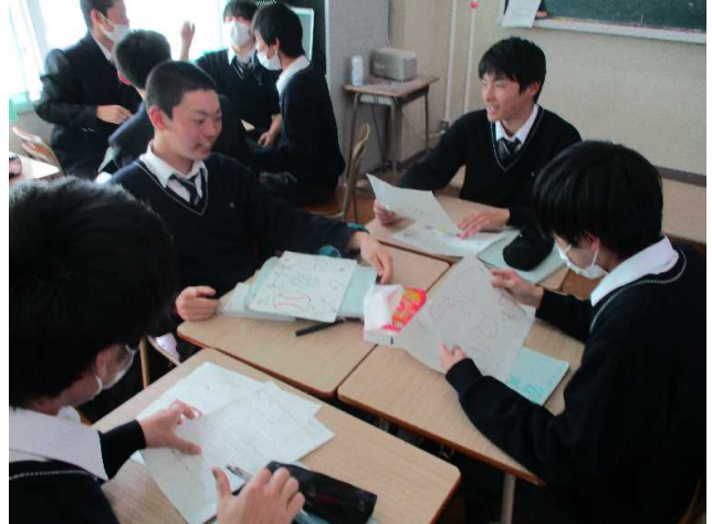
4人で進めています。