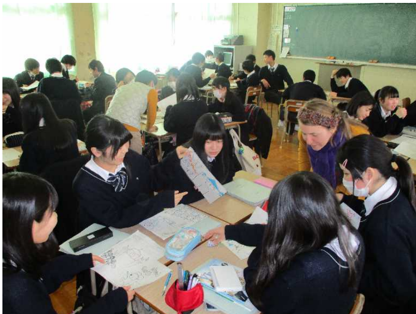
発表に備えて取組中！