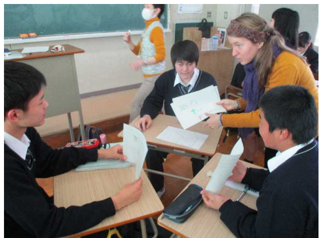
3人グループにハナ先生