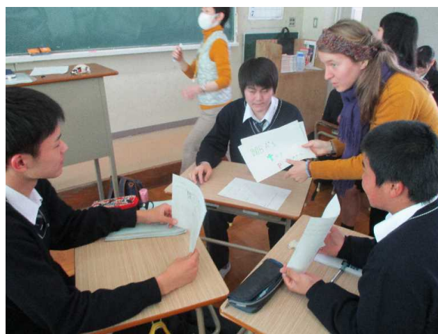
3人グループにハナ先生