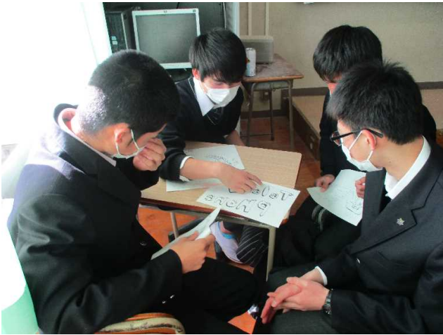
こちらも自分たちで進行中